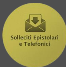
Solleciti Epistolari e Telefonici